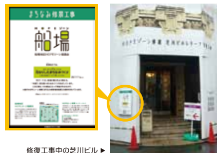
修復工事中の芝川ビル ▶