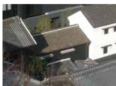
旧小西家住宅衣蔵等