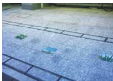
佐々木化学ビル オープンスペース修景