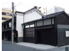
旧小西家住宅東側 駐車場ゲート