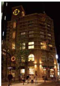
生駒ビルディング