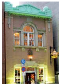
北浜レトロビルディング