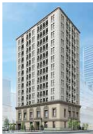
グランサンクタス淀屋橋