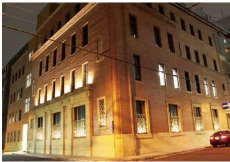
武田道修町ビル 平成25年度修景実施