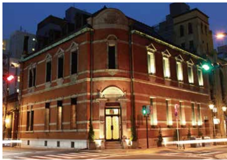
高麗橋ビル 平成25年度修景実施